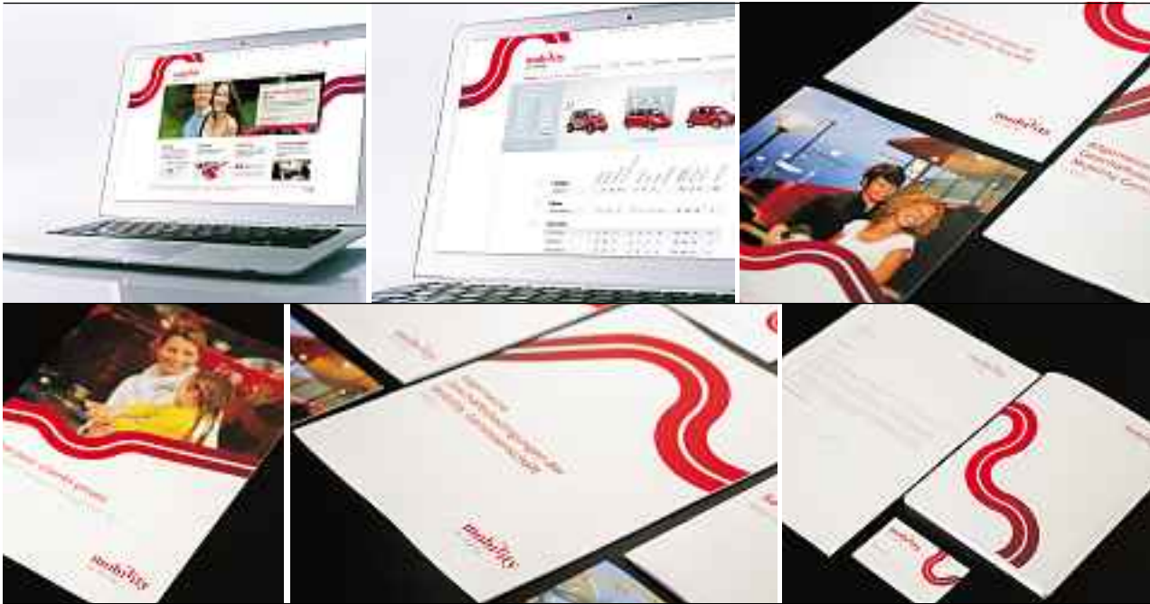
Das weiterentwickelte Erscheinungsbild widerspiegelt die Markenkernwerte «einfach», «modern», «zuverlässig», «clever» und «ökologisch».

ten basierend voranzutreiben. Die Wurzeln des ursprünglichen Logos sind nach wie vor erkennbar. Es wirkt nun aber frischer, eleganter und ist technisch einwandfrei reproduzierbar.