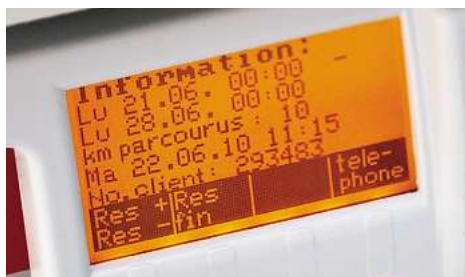
Si vous êtes de retour à l'emplacement avant la fin de la période réservée, vous pouvez libérer le véhicule avant terme en appuyant sur la touche «Res fin»,

Après environ quatre ans d'utilisation au sein de Mobility, les véhicules sont remplacés par des véhicules neufs. Un quart de la flotte est ainsi remplacé chaque année.