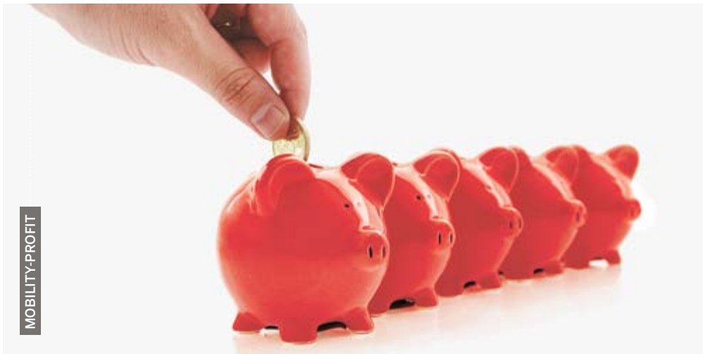
Régler à l'avance, ça paye.

Renseignements complémentaires sur www.mobility.ch/one-way_fr .