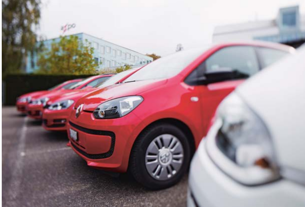
Axpo mise sur différents modes d'autopartage au quotidien.