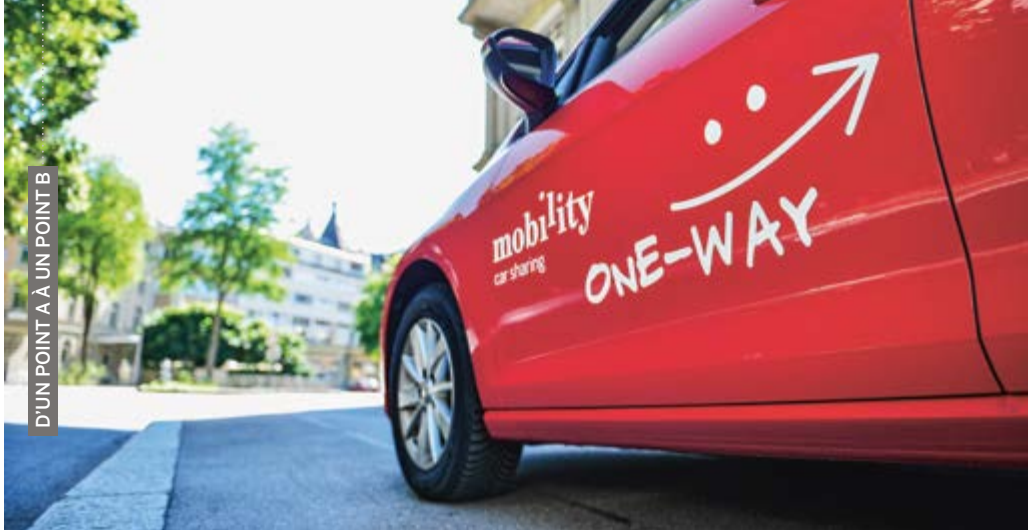
Cinq destinations en «aller simple».