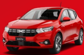
Dacia Sandero Kleinwagen Schon für: CHF 4'900/Jahr + Eigennutzung

Mit Mobility reduzierst du die Anzahl der Zweitfahrzeuge und positionierst deine Gemeinde als nachhaltigen und attraktiven Standort – auch als Arbeitgeberin. Zusätzlich steigerst du die Attraktivität für den Tourismus und profitierst von Mobility als starker Marke mit 280'000 Kund:innen. Für die Kommunikation vor Ort bekommst du von uns ein Marketing-Toolkit: weniger Aufwand für dich, und die lokale Bevölkerung ist bestens informiert. Worauf du dich sonst noch einlässt? Auf die Nummer eins der Schweiz im Carsharing und eine zuverlässige Partnerin für nachhaltige Mobilität. Und das seit 1997.