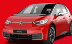
VW ID.3 Kompaktwagen Elektro Schon für: CHF 5'900/Jahr + Eigennutzung