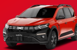
Dacia Jogger Station wagon