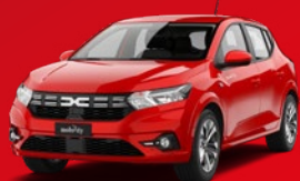
Dacia Sandero Vettura piccola A soli: CHF 4'900/anno + utilizzo proprio

Con Mobility riduci il numero di secondi veicoli e rendi il tuo comune sostenibile e attraente, anche come datore di lavoro. Inoltre aumenti l'attrattiva turistica e trai vantaggio dalla forza del marchio Mobility, con oltre 280'000 clienti. Per la comunicazione sul posto ricevi da noi un kit di strumenti di marketing, così potrai informare al meglio la popolazione locale con il minimo sforzo. Su cos'altro puoi contare? Sul numero uno del carsharing in Svizzera e su un partner affidabile per la mobilità sostenibile. Fin dal 1997.