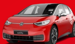
VW ID.3 Compatta elettrica A soli: CHF 5'900/anno + utilizzo proprio

SONO INOLTRE DISPONIBILI (prezzo su richiesta)