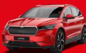
Škoda Enyaq (4x4) Station wagon elettrica

SONO INOLTRE DISPONIBILI (prezzo su richiesta)