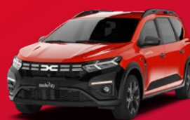
Dacia Jogger Kombi