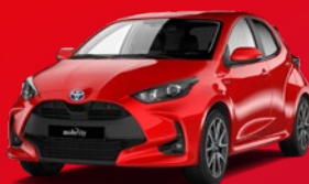
Toyota Yaris Kompaktwagen