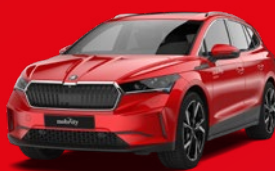
Škoda Enyaq (4x4) Kombi Elektro