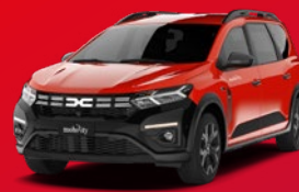
Dacia Jogger Kombi