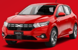
Dacia Sandero Kleinwagen Schon für: CHF 4'900/Jahr + Eigennutzung

Durch effizientes Carsharing spart dein Unternehmen wertvolle Parkplätze und lagert die Verwaltung der Poolfahrzeuge an Mobility aus. Zudem stärkt ihr euer Image als innovatives und nachhaltiges Unternehmen. Auf Wunsch bringen wir euer Firmenlogo auf den Mobility-Fahrzeugen an. Und: Eure Mitarbeitenden können die Fahrzeuge auch privat nutzen – ein attraktiver Benefit. Vertraut eure Flotte Mobility an, dem führenden Carsharing-Anbieter der Schweiz – seit 1997.