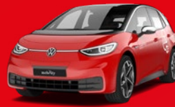
VW ID.3 Kompaktwagen Elektro Schon für: CHF 5'900/Jahr + Eigennutzung