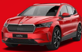
Škoda Enyaq (4x4) Kombi Elektro