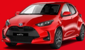
Toyota Yaris Kompaktwagen