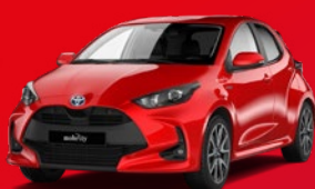
Toyota Yaris Voiture compacte