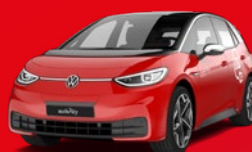
VW ID.3 Voiture électrique compacte À partir de: CHF 5'900/an + utilisation propre