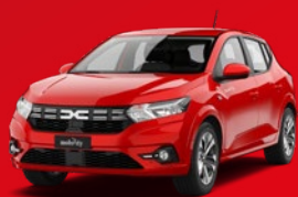
Dacia Sandero Petite voiture À partir de: CHF 4'900/an + utilisation propre

Un car sharing efficace permet à ton entreprise d'économiser des places de parc et de transférer la charge administrative des véhicules à Mobility. Il renforce en outre votre image d'entreprise innovante et durable. Si vous le souhaitez, nous pouvons apposer le logo de votre société sur les véhicules Mobility. Et ce n'est pas tout: vos collaboratrices et collaborateurs peuvent également utiliser les véhicules pour leur usage personnel – un atout non négligeable. Confiez votre flotte à Mobility, le leader du car sharing en Suisse – depuis 1997.